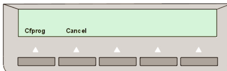
Figura 3. Se va apasa tasta Cfprog pentru a transfera audioconferinta

+40-264-555555 suna la +40-264-202222. Numarul de interior 2222 raspunde, se tasteaza *9311111234 si apoi se executa transferul. In felul acesta telefonul extern +40-264-555555 devine participant la audioconferinta gazduita de 1111 cu codul de acces 1234.