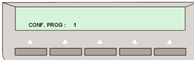
Figura 2. Numarul de participanti in conferinta este 1

Dupa stabilirea audioconferintei, se pot conecta si telefoane Polycom care vor asigura partea de videoconferinta. Deocamdata accesul este permis numai prin apelarea directa a unui numar de interior digital sau IP. Acesta va raspunde si se va tasta *93<Numar_de_telefon><cod_de_acces> si apoi se va redirija intrarea in audioconferinta spre telefonul Polycom.