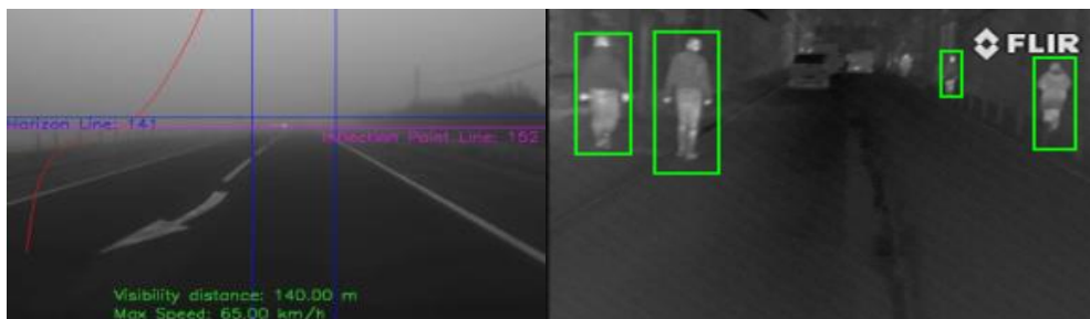
Rezultate obținute pentru (de la stânga la dreapta): detecția ceții și detecția pietonilor cu termoviziune.

Prin activitățile de cercetare-dezvoltare efectuate, UTCN a avut contribuții importante pe mai multe direcții: detecția ceții și restaurarea calității imaginilor afectate de ceață, detecția pietonilor pe dispozitive mobile, respectiv folosind camere cu termoviziune. Pentru aceste subiecte au fost dezvoltați algoritmi inovativi, îmbunătățind nivelul cunoașterii din domeniu. Pe baza acestor algoritmi au fost implementate aplicații pilot demonstrative. Metodele propuse au fost publicate în jurnale și conferințe internaționale de prestigiu (ex. IEEE Transactions on Intelligent Transportation Systems Journal , Conference on Computer Vision and Pattern Recognition – CVPR , IEEE Intelligent Vehicles Symposium ).